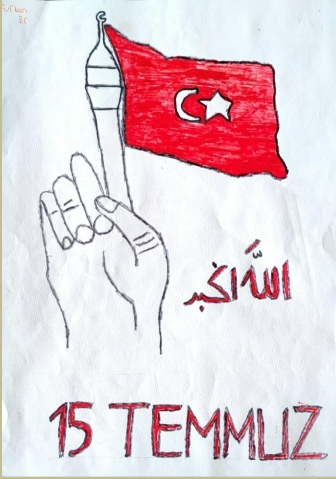
RESİM: FURKAN ER 8/A